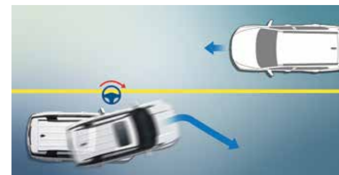
Έκτακτη Διατήρηση Λωρίδας - Προσπέραση Οχημάτων Βοηθά στον έλεγχο του οχήματος όταν ανιχνεύεται κίνδυνος από επερχόμενο όχημα κατά την προσπέραση.