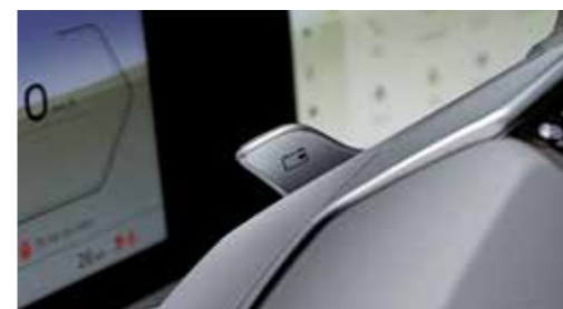
Επιλογή ισχύος ανάκτησης