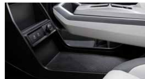
Κεντρικό κάτω συρτάρι