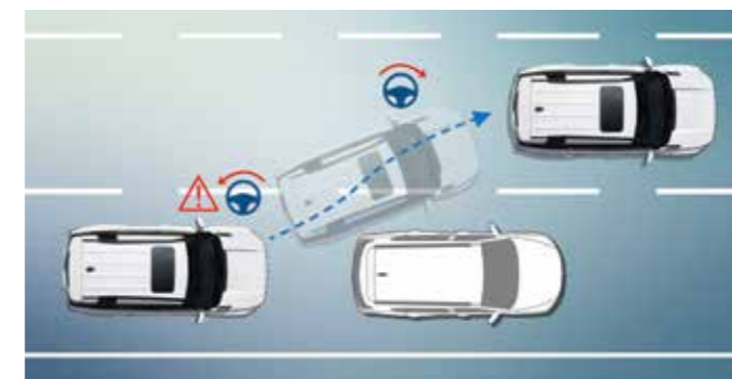
Έκτακτη Διατήρηση Λωρίδας - Υποβοήθηση Έκτακτου Τιμονιού Βοηθά στον έλεγχο του οχήματος με κίνηση προς την προτιμώμενη κατεύθυνση του οδηγού για να αποφύγει ένα εμπόδιο μπροστά.