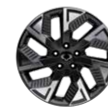
18" Ζάντες αλουμινίου diamond cut