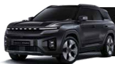
SPACE BLACK (LAK) (1-Tone Only)