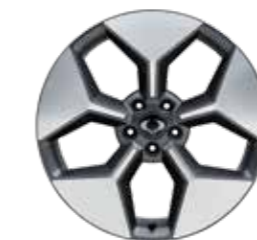
20" Ζάντες αλουμινίου diamond cut