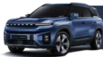
DANDY BLUE (BAS) (1-Tone Only)