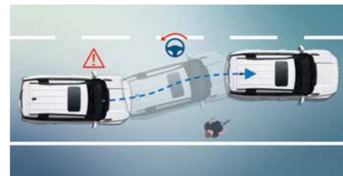
Έκτακτη Διατήρηση Λωρίδας - Αυτόνομο Έκτακτο Τιμόνι Κινεί αυτόματα το τιμόνι για να αποφύγει ένα εμπόδιο στη λωρίδα μπροστά.