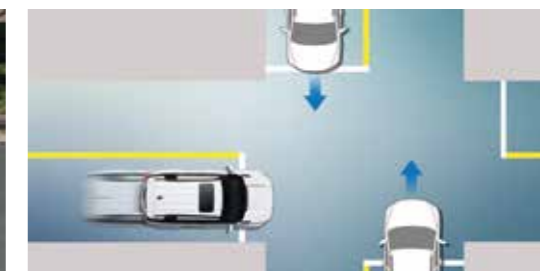
AEB - Σύστημα Πέδησης Έκτακτης Ανάγκης σε διέλευση διασταύρωσης