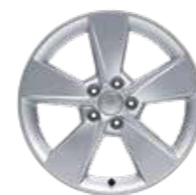
18" Ζάντες αλουμινίου