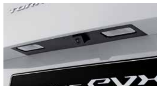
Κάμερα πίσω θέασης HD