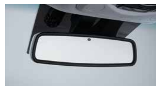
Ηλεκτροχρωμικός εσωτερικός καθρέφτης οπισθοπορείας