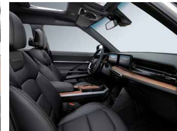
ΜΑΥΡΟ ΕΣΩΤΕΡΙΚΟ (LBH)