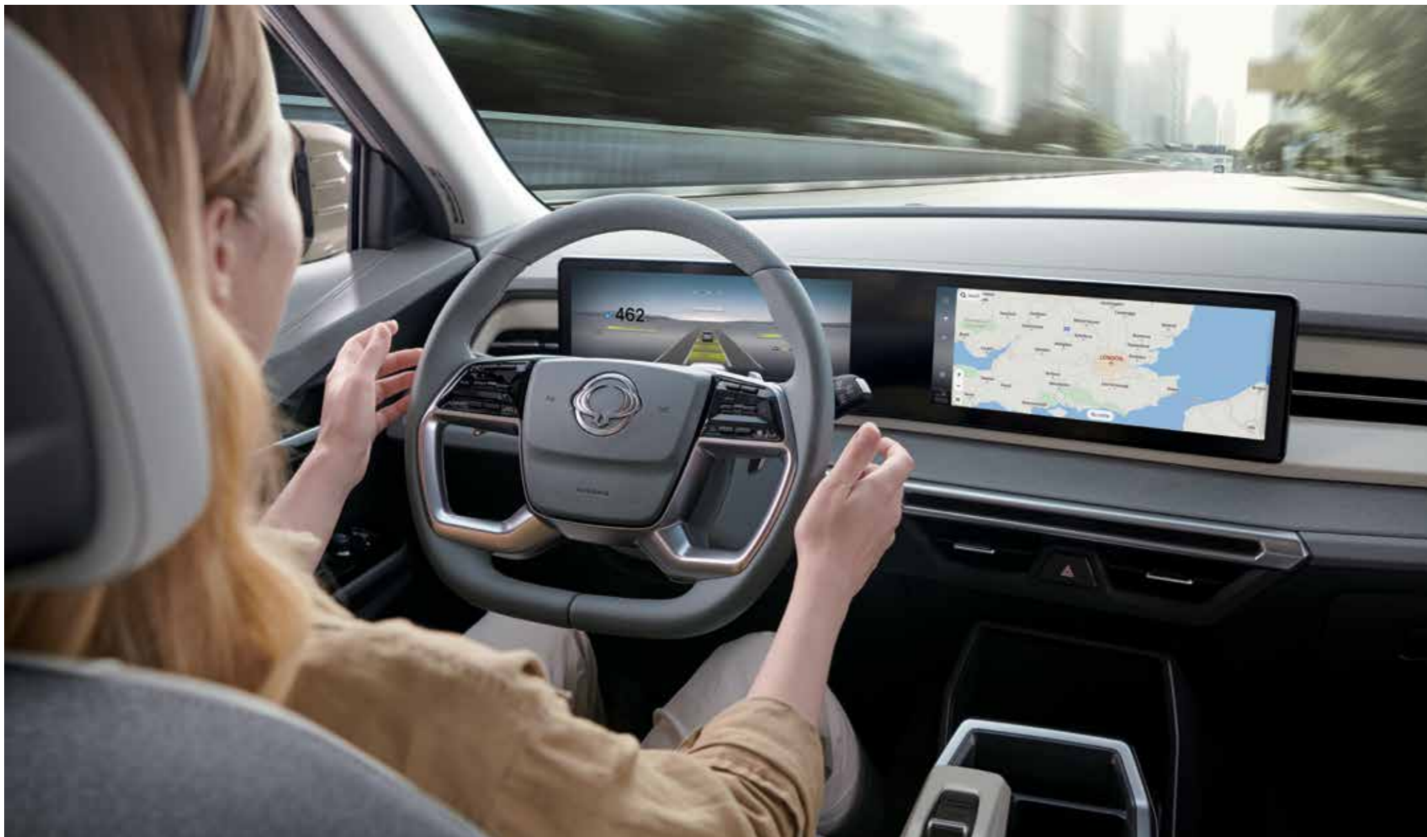
Προηγμένο Adaptive Cruise Control (IACC) Υποβοήθηση Διατήρησης Κεντρικής Θέσης Λωρίδας (CLKA)

Παρέχει υποβοήθηση διατήρησης στο κέντρο της λωρίδας σε οποιαδήποτε ταχύτητα. Βελτιώνει την άνεση παρακολουθώντας τις διαγραμμίσεις με την μπροστινή κάμερα και προσαρμόζοντας το τιμόνι.