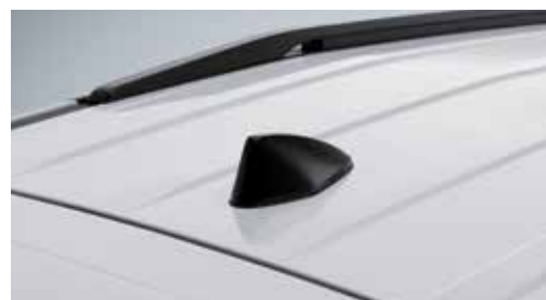
Αντένα τύπου "Shark fin"