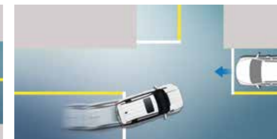
AEB - Σύστημα Πέδησης Έκτακτης Ανάγκης σε στροφή διασταύρωσης