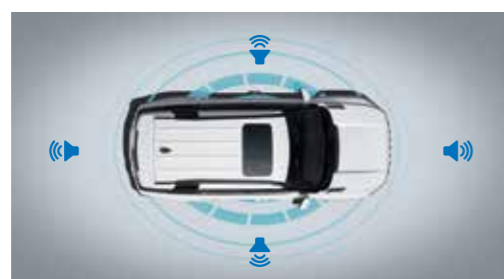
Σύστημα Εικονικού Ήχου Κινητήρα (VESS)