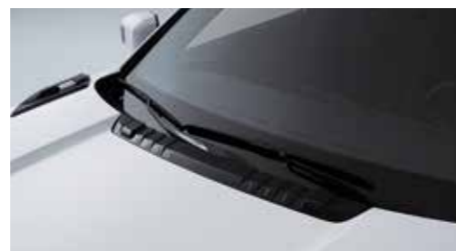
Υαλοκαθαριστήρες με αισθητήρες