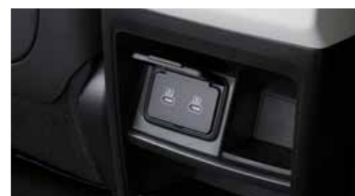
Θύρα USB και θύρα USB πίσω