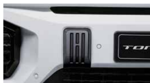
Κάλυμμα τοποθέτησης συστήματος ρυμούλκησης