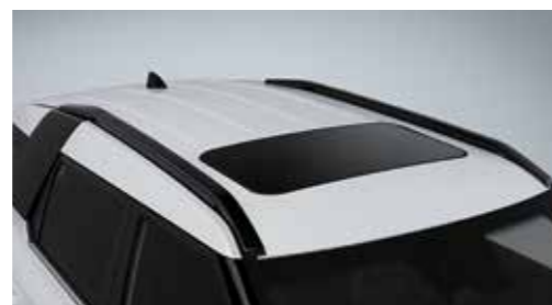
Μαύρες ράγες οροφής