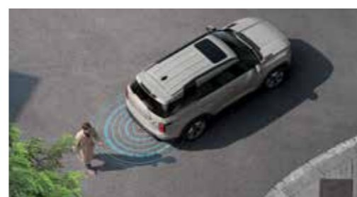
Σύστημα ηχητικής ειδοποίησης οχήματος (AVAS) κατά την οπισθοπορεία