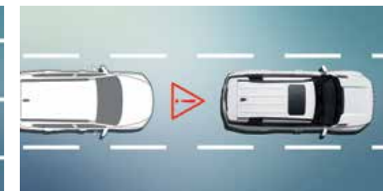
Προειδοποίηση Οπίσθιας Σύγκρουσης