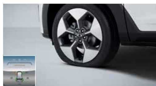
Σύστημα παρακολούθησης πίεσης ελαστικών