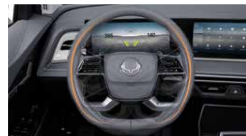
Θερμαινόμενο & δερμάτινο τιμόνι