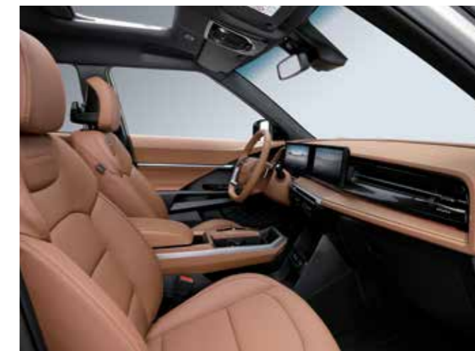
ΚΑΦΕ ΕΣΩΤΕΡΙΚΟ (ΟΒΒ)