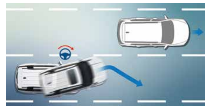
Έκτακτη Διατήρηση Λωρίδας - Προσπέραση Οχημάτων Βοηθά στον έλεγχο του οχήματος όταν ανιχνεύεται κίνδυνος από γειτονικό όχημα κατά την προσπέραση.

Όπου κι αν σας οδηγήσει το πνεύμα της περιπέτειας, φτάστε με ασφάλεια και σιγουριά στον προορισμό σας. Με την ενσωμάτωση καινοτόμων τεχνολογιών, το Torres EVX προσφέρει μια ολοκληρωμένη σειρά προηγμένων συστημάτων υποβοήθησης οδήγησης, καθιστώντας το ένα από τα ασφαλέστερα και πιο άνετα αυτοκίνητα για οδήγηση και ταξίδι.