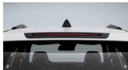
Σπορ πίσω αεροτομή με υψηλά τοποθετημένο LED φως φρένου