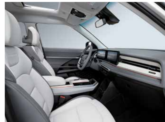
ΓΚΡΙ ΠΕΤΡΟΛ & ΓΚΡΙ ΛΕΥΚΟ ΕΣΩΤΕΡΙΚΟ (ADF)