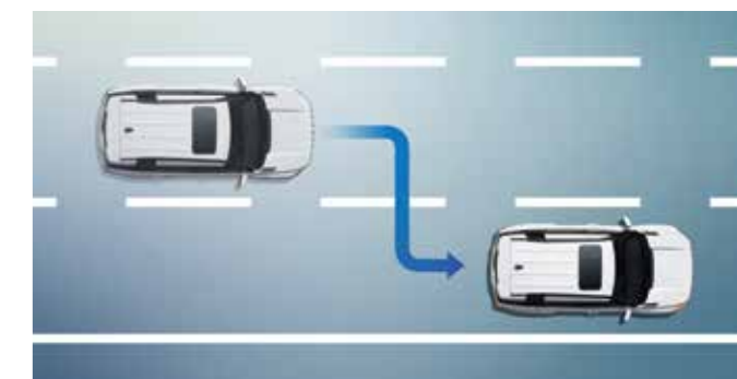
Αυτόματη Αλλαγή Λωρίδας Η Αυτόματη Αλλαγή Λωρίδας βάσει Πλοήγησης αλλάζει αυτόματα λωρίδες στον αυτοκινητόδρομο ή την εθνική οδό. Το όχημα θα στρίψει προς την κατεύθυνση που ενεργοποιείται από το φλας.