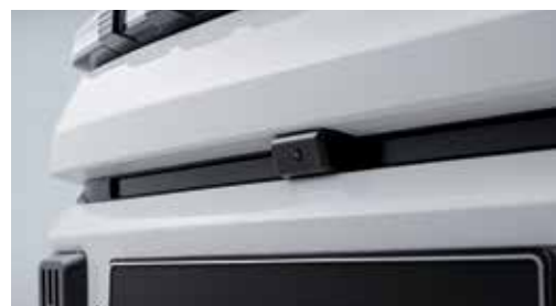
Κάμερα μπροστινής θέασης HD