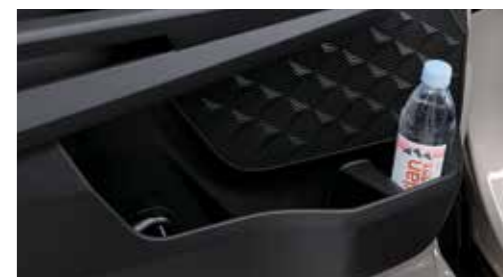
Θήκες στο υποβραχιόνιο