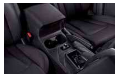
Κεντρική κονσόλα με αυτόματο κιβώτιο ταχυτήτων