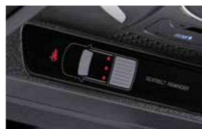
Υπενθύμιση ζώνης ασφαλείας (SBR)