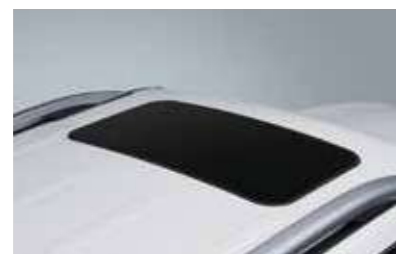
Ηλεκτρική ηλιοροφή ασφαλείας