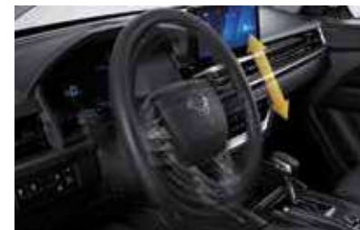
Έλεγχος της γωνίας κλίσης του τιμονιού