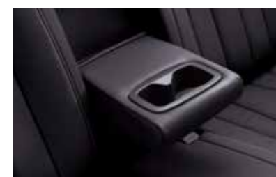
Κεντρικό υποβραχιόνιο καθίσματος 2ης σειράς με ποτηροθήκη