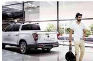
Σύστημα αυτόματου κλειδώματος θυρών

Χαρακτηριστικά που κάνουν το ταξίδι σας ασφαλέστερο, πιο βολικό και απολαυστικό.