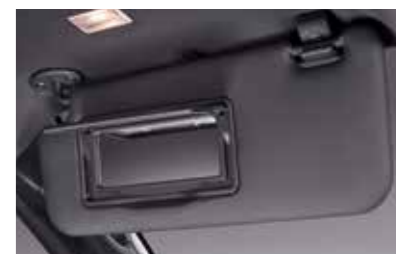
Άλεξήλια με καθρέπτη & φως