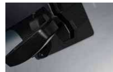
Μονάδα εμπρόσθιας κάμερας με αισθητήρα βροχής και αυτόματο έλεγχο φώτων