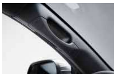
Χειρολαβές της κολόνας A