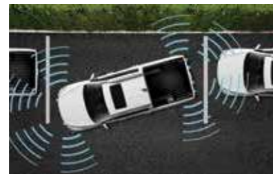
Αισθητήρες παρκαρίσματος εμπρός / πίσω