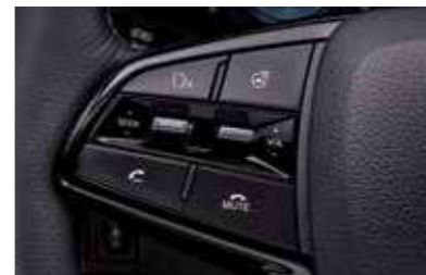
Χειριστήρια ήχου στο τιμόνι