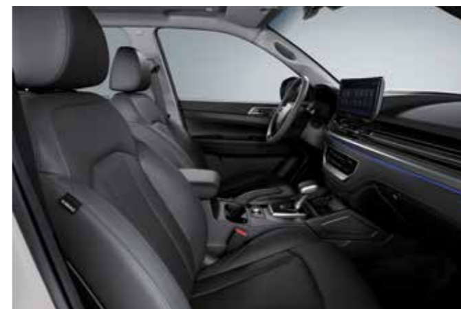
ΜΑΥΡΗ & ΓΚΡΙ ΤΑΠΕΤΣΑΡΙΑ