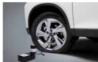
Kit επισκευής ελαστικών