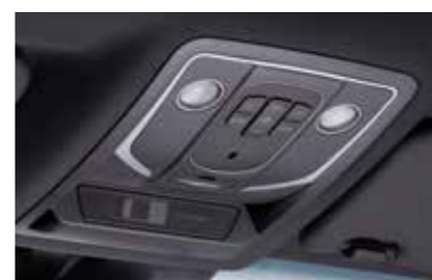
Κονσόλα οροφής με φώτα χάρτη LED