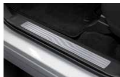
Μπροστινό ανοξείδωτο μαρσπέι εισόδου