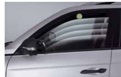
Ηλεκτρικά παράθυρα ασφαλείας