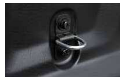
Άγκιστρα πρόσδεσης στο χώρο φόρτωσης