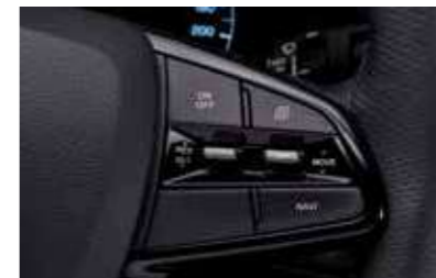
Διακόπτες cruise control στο τιμόνι