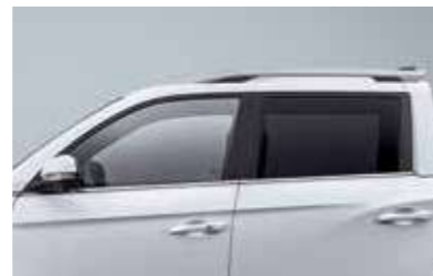
Φυμέ τζάμι πίσω πόρτας