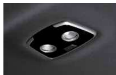
Φως καμπίνας LED