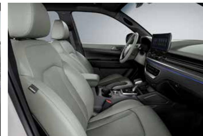
ΧΑΚΙ & ΜΑΥΡΗ ΤΑΠΕΤΣΑΡΙΑ