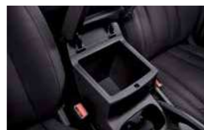
Κουτί κεντρικής κονσόλας