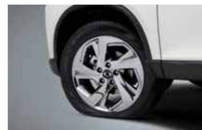
Σύστημα παρακολούθησης της πίεσης των ελαστικών (TPMS)