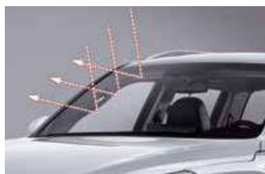
Παρ-μπριζ με προστασία UV