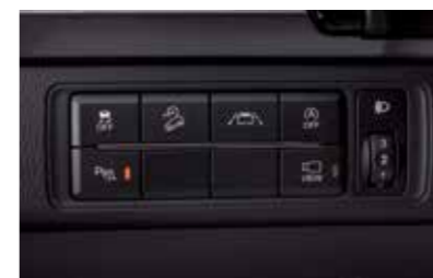
Ενσωματωμένη μονάδα διακοπών