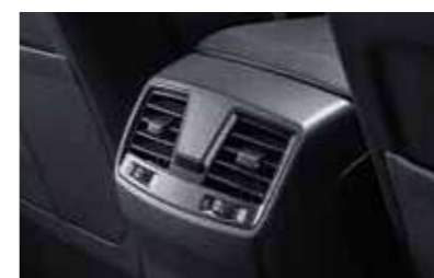
Αεραγωγός 2ης σειράς