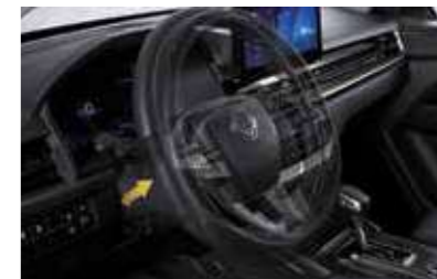
Τηλεσκοπικό τιμόνι Rake & Reach