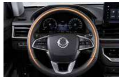
Θερμαινόμενο δερμάτινο κάλυμμα τιμονιού